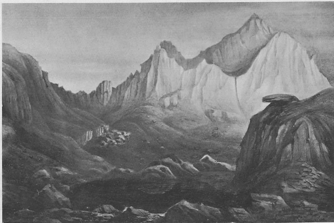
Die Negoi-Spitze von der Südwest-Seite.