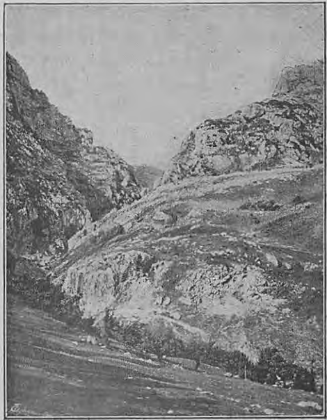
Piatra roşia (Roşia-Lesia).